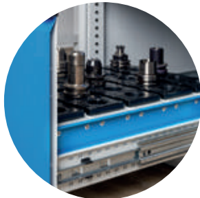
Schublade mit CNC-Schubladenrahmen